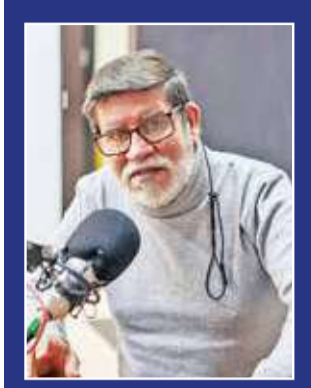
Por: Fernando Amado

En el año de 1958, aparece en la palestra política, Gabriel Antonio Goyeneche, un soachuno, quien, debido a una epidemia de gripa en 1918, sufrió secuelas de locura. Postulado a la presidencia de la república en cinco ocasiones, sus propuestas descabelladas generaban toda clase de comentarios risibles y controversiales.